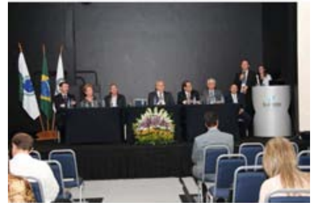
Abertura do evento