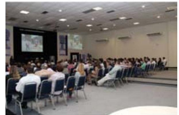
Presença do público