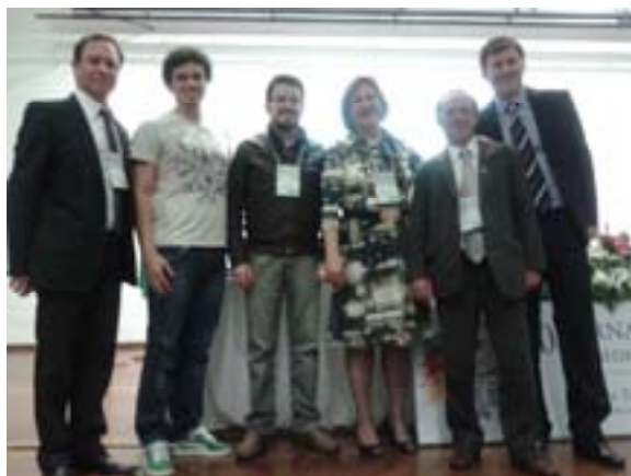
Jornada da SOGAMT