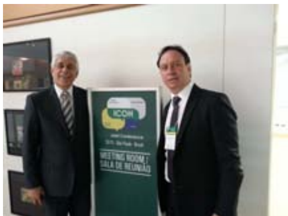
9º Congresso ICOH dos Trabalhadores da Saúde